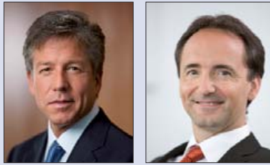
Bill McDermott (à gauche) et Jim Hagemann

Le dirigeant sera remplacé par deux personnes : Bill McDermott , Chef de l'organisation et Jim Hagemann Snabe, Responsable du développement produit. A cette codirection s'ajoute Vishal Sikka, Directeur technique, nommé au Conseil Exécutif. Hasso Plattner, co-Fondateur de SAP poursuivra