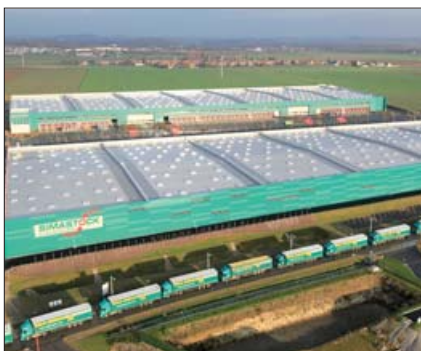
Des plates-formes complètement vertes.

G ecina, société d'investissement immobilier, attaque le marché logistique avec une marque dédiée « Gecilog ». Le parc logistique, baptisé Logistiparc Nord et situé sur la commune de Lauwin-Planque (59), est en cours de certification HQE. Grâce à une isolation renforcée des bâtiments couplée à des systèmes de gestion des consommables énergétiques et de l'eau, Logistiparc Nord est particulièrement économe en énergie. Par ailleurs, il a été conçu pour se fondre dans son environnement avec notamment la création d'espaces verts et l'intégration d'allées piétonnières et cyclables. Les 40 ha seront occupés par quatre bâtiments. Le premier de 32.000 m 2 a été livré en août 2009 à