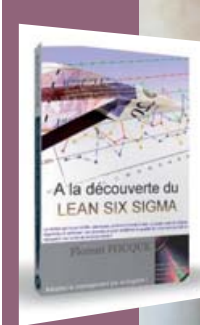
Florent Fouqué, Consultant chez Axsolu

source du projet. Alors, si vous êtes Consultant, Responsable Qualité, ou plus largement en charge d'un processus à optimiser, bonne lecture ! Sortie du livre broché de 270 pages le 15 mars (36 €)