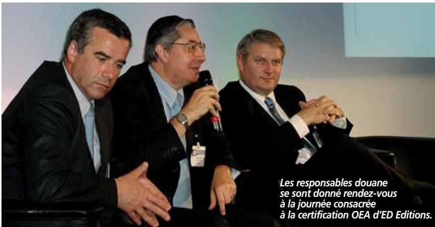
Les responsables douane se sont donné rendez-vous à la journée consacrée à la certification OEA d'ED Editions.