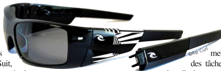
Des lunettes Rip Curl

déploiement de e-SCM.com par le groupe Rip Curl sur 6 de ses divisions produits (EyeWear, FootWear, WetSuit, SurfWear, MountainWear et équipements) et sur l'ensemble de ses cinq régions (Australie, Europe, Asie, Amérique du Nord et du Sud). E-SCM.com récupère par interface avec l'ERP (Iris Confection, en cours de remplacement par M3 de Lawson Software) les ordres d'achats issus des commandes clients consolidées, ainsi que les dossiers techniques associés. Les dates de programmation de ces ordres d'achats sont calculées sur la base des prévisions de ventes clients. Au fur et à mesure que les prévisions deviennent des commandes fermes, les ordres d'achats sont affinés. Pour