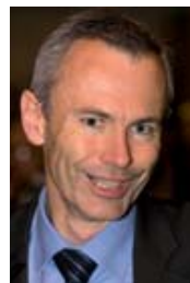
Pierre Fournet (Möbius)