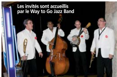
Les invités sont accueillis par le Way to Go Jazz Band