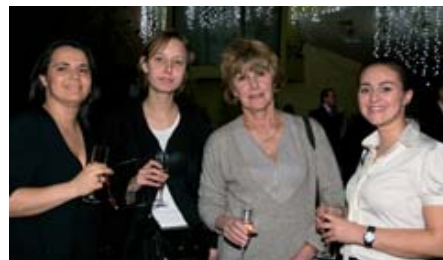
L'équipe de BG Presse