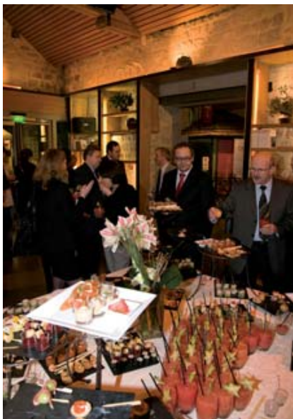
La soirée démarre par un cocktail de bienvenue