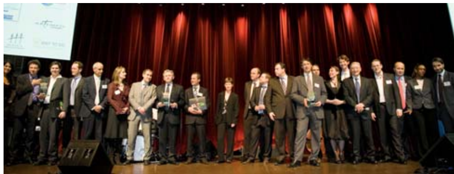
L'ensemble des sponsors et des lauréats des Rois de la Supply Chain 2008