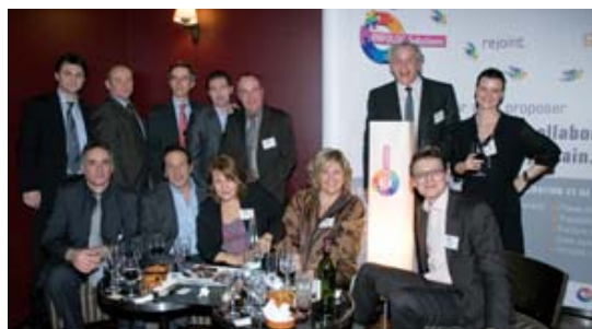
L'équipe d'Infolog Generix Group