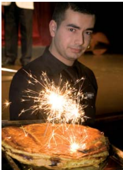
Pas de fête sans galette !