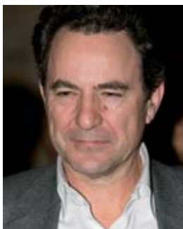
Alain Bagnaud (Reed Exhibition)