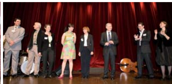
L'équipe de Supply Chain Magazine