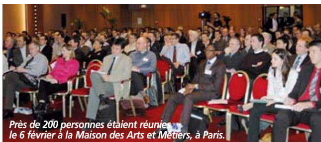
Près de 200 personnes étaient réunies le 6 février à la Maison des Arts et Métiers, à Paris.

wick s'implique dans la conception de l'entrepôt et quels paramètres sont à prendre en compte pour obtenir le meilleur coût-performance. L'ensemble des conférences ont été filmées par la société Brainsonic. JPG Les vidéos et les slides de ces présentations sont sur notre site www.SupplyChainExpo.fr .