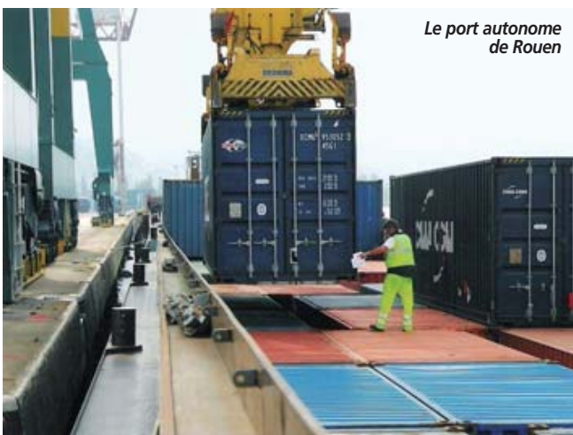
Le port autonome de Rouen

La construction des bâtiments commencera en mai pour une mise à disposition fin décembre 2008. Parallèlement à ce projet, le groupe GA fait également construire sur la Zac de Parisud IV à Combs-la-Ville (77) une plate-forme de 19.000 m 2 . Elle sera livrée en juillet à Caprim qui l'a vendue à Parcolog. JPG