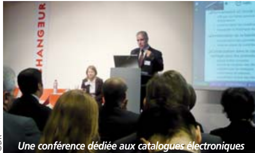
Une conférence dédiée aux catalogues électroniques