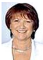
estime Danièle Kapel-Marcovici, PDG de Raja. JPG

Suite à un appel d'offres, le comité de pilotage du groupe Raja (vente d'emballages et de consommables), a choisi d'implémenter la solution Microsoft Dynamics AX ainsi que le vertical métier « Pack VAD » de TVH Consulting. Cette solution concerne toutes les entités et tous les métiers du groupe. L'ERP sera le socle commun pour la gestion multinationale, multilingue et multiplateforme commerciale et logistique. En outre, la connectivité de l'outil facilitera l'intégration du logiciel Périgrée qui réalise la préparation et la fabrication des catalogues papier et Web. « Il s'agit d'un projet fédérateur, captivant et stratégique, facteur d'excellence et d'avantages concurrentiels décisifs »,