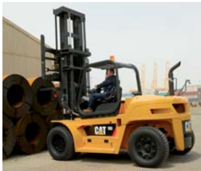
Un des modèles de la gamme CAT DP80-160N

Aprolis, distributeur exclusif des chariots élévateurs Caterpillar en France, annonce la disponibilité de 7 nouveaux modèles diesel « Cat Lift trucks » gros tonnages, allant du 8 tonnes jusqu'au 16 tonnes. De conception ergonomique ces chariots disposent d'une grande maniabilité et répondent aux normes antipollution. Le constructeur a renforcé la sécurité avec, par exemple, un marche pied anti-dérapant, une longue main courante, un poste de conduite doté d'une visibilité panoramique ainsi que le système de présence cariste (PDS) qui neutralise les fonctions hydrauliques, dès lors que le chauffeur n'est plus assis sur son siège. A signaler également, une réduction significative des nuisances sonores et des vibrations. Cette gamme a été conçue pour faciliter les contrôles journaliers et les entretiens grâce à une panoplie de systèmes embarqués et aux différentes fonctions de protection. JPG