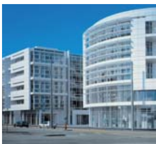
Panalpina, siège Suisse

De grands commissionnaires de transport internationaux sont soupçonnés de violer des législations antitrust, en particulier celles de l'Union Européenne, rapporte le cabinet