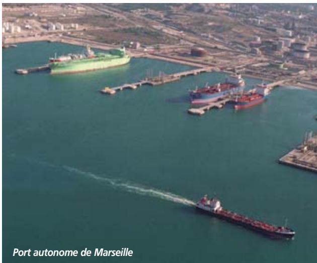
Port autonome de Marseille