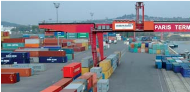
Le terminal à conteneurs du Port de Gennevilliers.

Le Port Autonome de Paris connaît une croissance de 36 % du trafic francilien de conteneurs sur les 8 premiers mois de l'année 2007. La plus grande partie de cette croissance s'effectue par voie d'eau sur les ports de Gennevilliers et de Bonneuil.