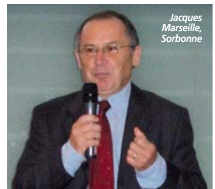
Jacques Marseille, Sorbonne

tion d'information dans l'entreprise, surtout au niveau des cadres. centres de cross-docking à un entrepôt central, jugé trop coûteux. En effet, 80 % des références sont très peu vendues par mois. Cette organisation remplace la livraison directe par colis des 415 magasins par 300 fournisseurs. Les magasins passent commande via le module SAP Retail du groupe, les