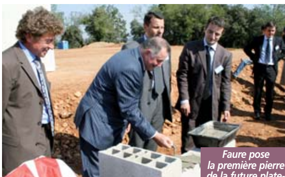
Faire pose la première pierre de la future plateforme de Laudun.

terme). « C'est le plus grand projet créateur d'emplois directs et indirects dans le Gard depuis longtemps », devait souligner un élu local. Par ailleurs, un effort particulier a été mis sur les aspects environnementaux, comme l'isolation qui serait de 50 % supérieure aux standards nationaux, permettant une réduction non négligeable d'énergie. JPG