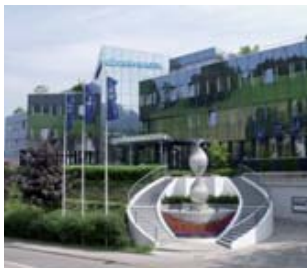
Kuehne+Nagel siège Suisse

d'études Analytiqa. Des opérations à l'initiative de différentes autorités anti-trust ont été menées simultanément à travers le monde début octobre. Les enquêteurs, qui auraient pu agir grâce à un informateur au sein d'une des entreprises visées, ont perquisitionné de manière inopinée dans différentes compagnies. Plusieurs commissionnaires ont officiellement réagi par communiqué de presse, parmi lesquels Kuehne+Nagel, EGL, Panalpina et Schenker. Le groupe suisse Kuehne+Nagel, dont des bureaux en Suisse, aux Etats-Unis et en Grande-Bretagne ont été inspectés, « ne voit pas de raison de suspecter des activités anti-compétitives et juge l'inspection excessive ». L'américain Eagle Global Logistics (EGL), récemment acquis par Ceva Logis-