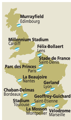
Les douze villes hôtes

Responsables logistiques sites les accompagnent depuis juillet. Le comité d'organisation, pour des questions de coûts, ne fait pas appel à des prestataires logistiques, hormis Sernam, choisi par consultation pour certaines missions. « Nous avons organisé des processus logistiques en interne avec location de véhicules utilitaires et implication de salariés, intérimaires et volontaires ». Les prestataires associés (licensing, technologie...) gèrent eux-mêmes leurs stocks.