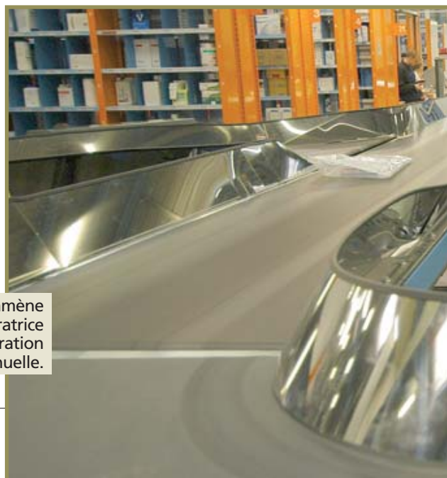
Le convoyeur amène les sachets jusqu'à l'opératrice dans la zone de préparation manuelle.