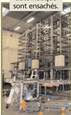
Les produits commandés référencés dans le magasin automatique sont ensachés.

Proche de Roissy, la plate-forme logistique Exostiv qui fonctionne six jours sur sept, se charge de livrer les 49 établissements de répartition OCP, partout en France. Une commande d'un produit stocké chez Exostiv passée avant 18 h est acheminée avant 10 h le lendemain matin à l'établissement de répartition. Le transport peut être routier, via GLS ou Ciblex, ou aérien dans 20 % des cas. Les produits provenant d'Exostiv sont alors consolidés dans chaque établissement avec d'autres