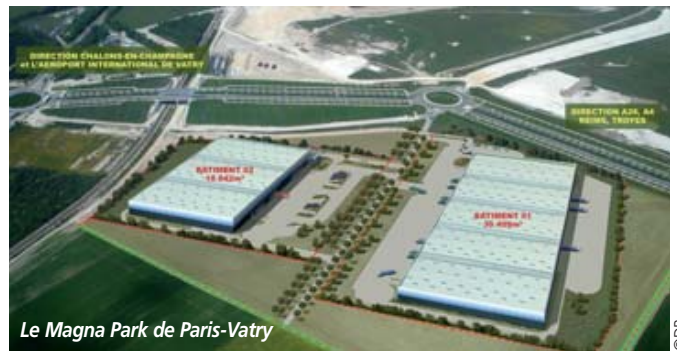
Le Magna Park de Paris-Vatry

King Sturge, un permis de construire aurait déjà été obtenu pour un premier bâtiment de 18.000 m 2 . JPG