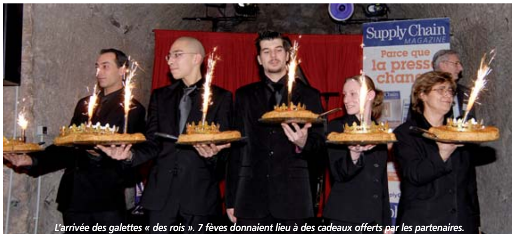
L'arrivée des galettes « des rois ». 7 fèves donnaient lieu à des cadeaux offerts par les partenaires.