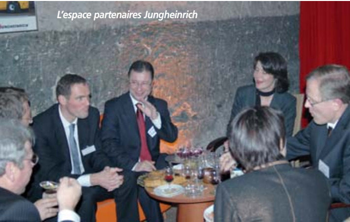
L'espace partenaires Jungheinrich