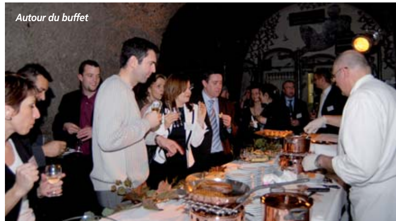
Autour du buffet