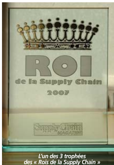
L'un des 3 trophées des « Rois de la Supply Chain »