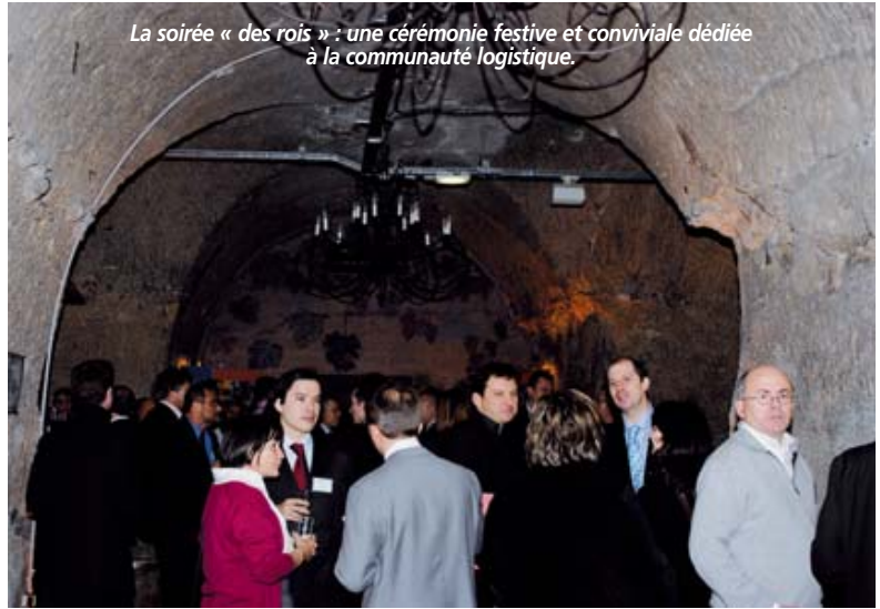
La soirée « des rois » : une cérémonie festive et conviviale dédiée à la communauté logistique.