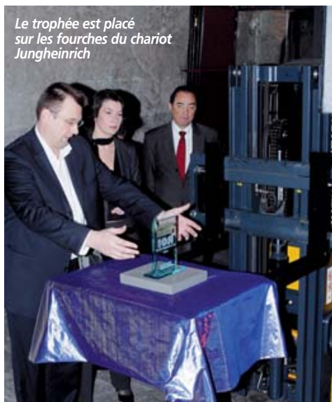
Le trophée est placé sur les fourches du chariot Jungheinrich