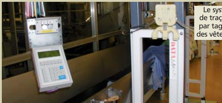
Le système de traçabilité par tag passif des vêtements.

Dans la blanchisserie, un système de traçabilité des vêtements s'appuyant sur le marquage du linge avec des codes à points lus par une caméra a été mis en place il y a deux ans. Il a été remplacé par un système de tag RFID passif de la société Thermopatch. Le ROI a été récemment atteint ; le gain est de deux à trois secondes par vêtement grâce au système RFID. Or, la plupart des vêtements nominatifs (tous d'ici deux ans) appartenant à l'un des 6.500 collaborateurs du CHU, portent un tag. Ils représentent la moitié des 9.000 vêtements lavés chaque jour. L'opératrice passe le vêtement devant un lecteur et l'information de son service de destination est transférée sur le cintre, lui aussi équipé d'une puce. Ce dernier passe ensuite sur le trieur automatique avant d'être livré dans les armoires à linge. « Il a fallu vaincre la crainte des collaborateurs qui arrachaient au départ la puce RFID de peur d'être fliqués », explique un responsable qualité. Mais la moutarde ne leur est montée au nez qu'un temps, les efforts d'accompagnement ayant triomphé des réticences.