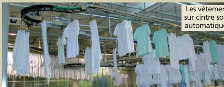
Les vêtements mis sur cintre sont triés automatiquement.