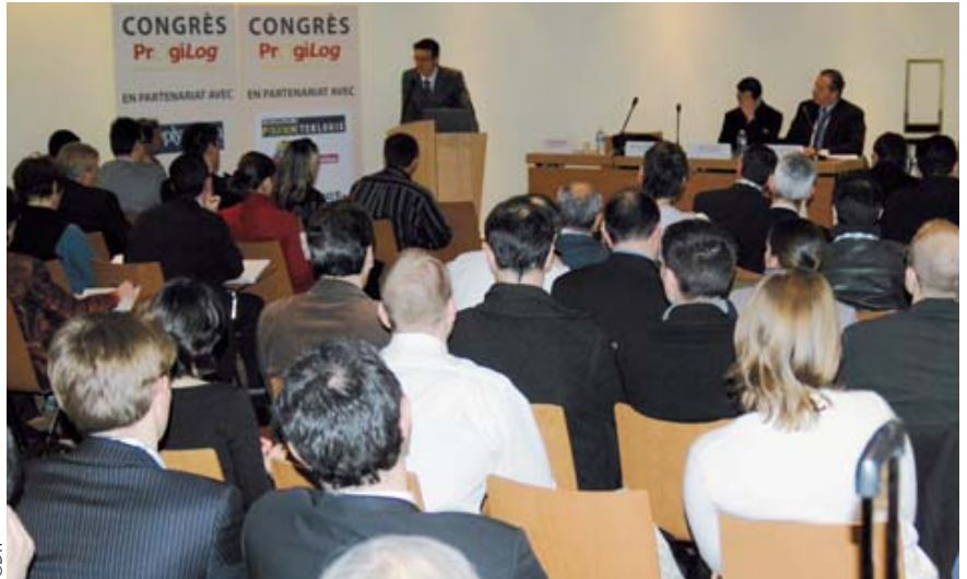
Grand succès pour le congrès Progilog organisé par « Supply Chain Magazine »

Compte rendu complet en page 24 de ce numéro. Un film vidéo est également téléchargeable sur notre site Internet. JPG