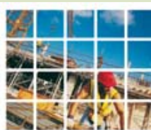
Observatoire de la Supply Chain Sourcing dans les pays à bas coûts "Quels impacts sur la performance et l'organisation de la Supply Chain?"

S'approvisionner et produire dans les pays à bas coûts peut paraître économique. Mais lorsque l'on y rajoute les coûts de transport, l'augmentation des stocks,