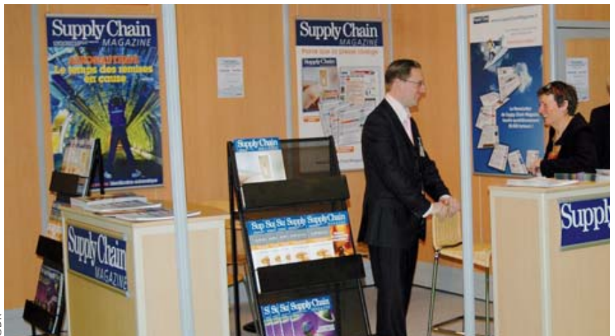
Stand de Supply Chain Magazine