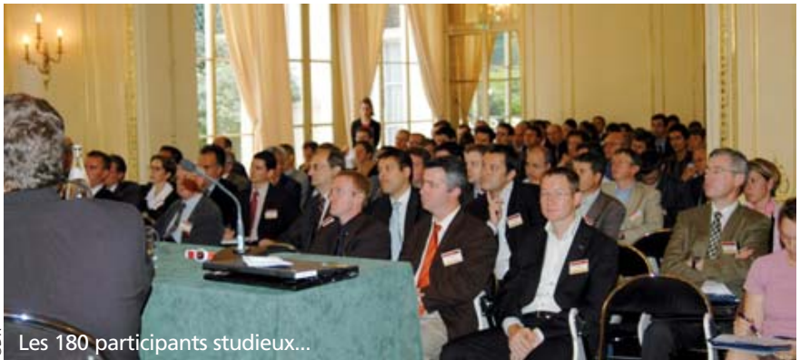
Les 180 participants studieux...

travers les nouvelles fonctionnalités de sa version SAP SCM 5.0. que l'éditeur a présentées à travers dix ateliers thématiques portant notamment sur les APS, la traçabilité, la RFID, la collaboration client et fournisseur ainsi que la gestion du transport. Soucieux de développement durable, l'éditeur allemand travaille d'ailleurs sur un projet pour 2008 « Green World Supply Chain ».