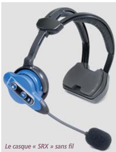
Le casque « SRX » sans fil

Nous l'avions annoncé dans la Newsletter N°53 du 10 mars, c'est à présent une réalité : Vocollect lance le premier casque à reconnaissance vocale sans fil pour environnements industriels. Baptisé « SRX », il se démarque des casques Bluetooth classiques en répartissant uniformément le traitement de la reconnaissance vocale entre lui et le logiciel Vocollect Voice. L'avantage est avant tout ergonomique, dans la mesure où il facilite l'application de la commande vocale reliée à un terminal déporté (sur un chariot élévateur, par exemple). Dépourvu de câbles, il améliore le confort et la sécurité. Grâce au chargement automatique du profil de l'utilisateur, quelques secondes suffisent pour le rendre opérationnel. JPG