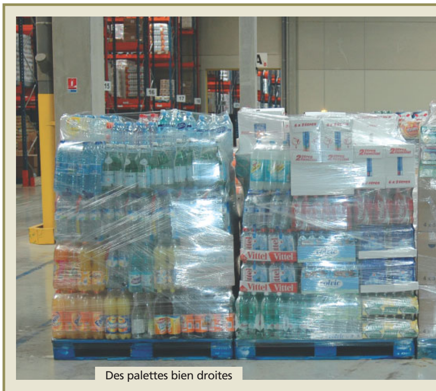
Des palettes bien droites

Au sein de l'entrepôt Système U de Miramas, Vincent Coupier, pilote d'exploitation, gère les opérations au quotidien : « Les commandes sont effectuées par Système U qui positionne sur le planning un jour de livrai-