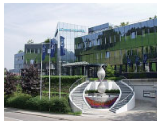
Le siège de Kuehne+Nagel, à Schindellegi, en Suisse.

En 2005, le groupe a réalisé un chiffre d'affaires de 8,94 Md€ en hausse de 21,5 %, pour un résultat net de 200,4 M€ (+32,3%). Le dernier contrat remporté par la firme est un contrat de logistique de pièces détachées pour Toyota,