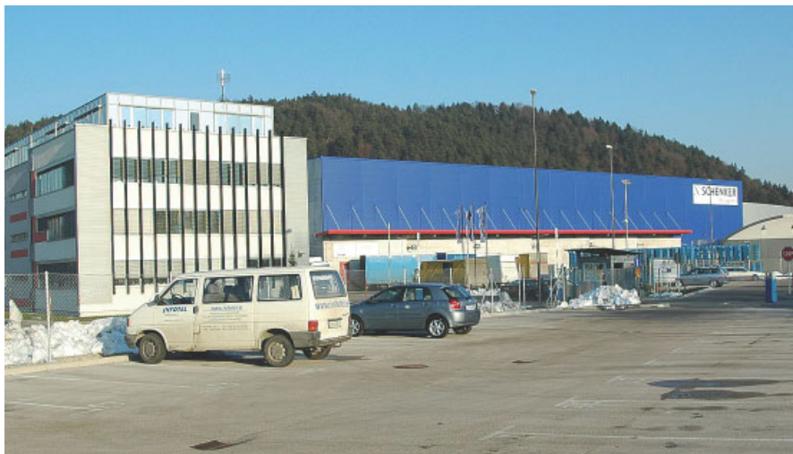
En 2005, la plate-forme de Ljubljana a été étendue à 23.000 m 2 .

Schenker opère depuis début 2006 sous la marque Schenker d.d. en Sloénie, offrant l'ensemble des services liés à la chaîne logistique, y compris le transport multimodal, en liaison avec le réseau Schenker. L'intégration du logisticien Intertrans, acquis il y a trois ans, est à présent achevée. En 2005, la plate-forme de Ljubljana a été étendue à 23.000 m 2 . Des multinationales de l'automobile, de la pharmacie, des PGC et de l'électronique recourent ainsi aux services de Schenker. CC