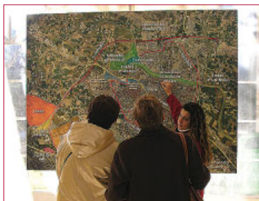
Carreras va investir une partie de l'immense plate-forme actuellement en projet à Saragosse, qui se veut carrefour du sud de l'Europe. Objectif de ce futur pôle logistique de 1.206 hectares : faire transiter chaque année 5 millions de tonnes de marchandises.

Catalogne. Avec Whirlpool, Fiege Iberia a conclu un accord pour l'entreposage et la distribution exclusive au Portugal, en espérant étendre rapidement cette collaboration au reste de la péninsule. Ces deux nouveaux clients garantissent en tout cas déjà une croissance probable pour 2006 : Fiege Iberia mise sur une augmentation de 20 % de son chiffre d'affaires cette année, après avoir déjà progressé de 10 % en 2005, avec un C.A. de 60 M€. Ce qui se traduit aussi par une croissance identique de l'activité transport, qui reste entièrement sous-traitée, mais mobilise aujourd'hui un potentiel de 500 camions en Espagne. FM