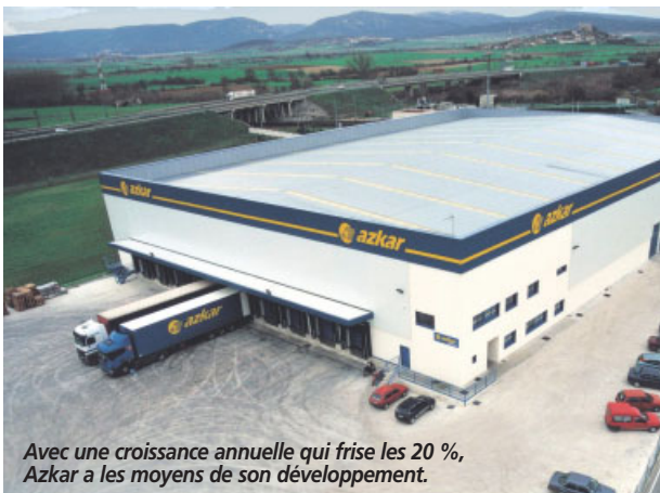
Avec une croissance annuelle qui frise les 20 %, Azkar a les moyens de son développement.

Le chiffre d'affaires de l'activité logistique du groupe Azkar, l'un des premiers opérateurs en Espagne, a augmenté l'an dernier de 19,9 %. Fort de ce bilan, le groupe prévoit une série d'investissements logistiques dans le courant de l'année 2006. À commencer par l'inauguration déjà réalisée en janvier d'une plate-forme de 13.300 m 2 à Vigo. Azkar ouvrira également en mars une unité de stockage et gestion de produits pharmaceutiques près de Madrid (2.000 m 2 d'entrepôts sous température dirigée). Le mois suivant, Azkar inaugurerà une plate-forme à Castellon (près de Valence) dédiée à l'entreposage de produits céramiques. Et c'est en juillet que